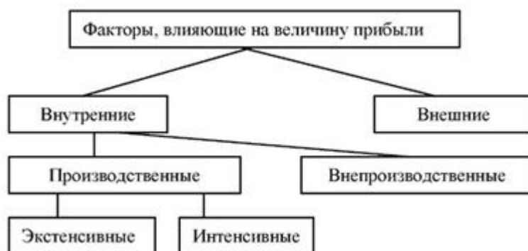
Рис.16. Классификация факторов, влияющих на величину прибыли Внутренние факторы увеличения прибыли предприятия: